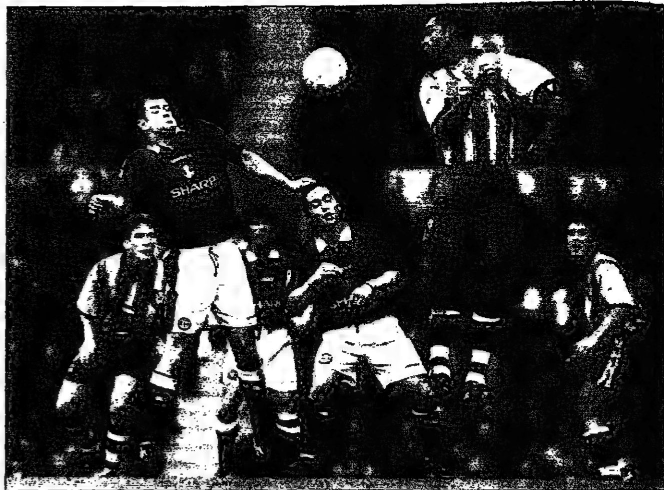
حاري بلانستر لاعب مانشستر يونايتد في الكرة في فترة في الهواء